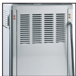
显示可选 后原料灯