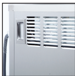
显示标准 拉出式把手