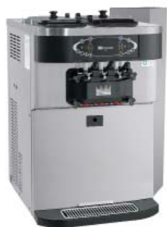
Показано с верхним воздухоотводом (заказное оборудование)