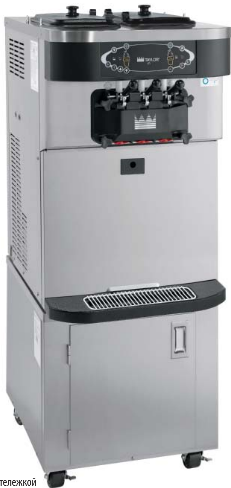
Показано с тележкой стандартной высоты (заказное оборудование)