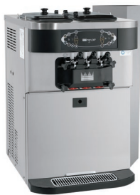
Se muestra con la opción de canaleta de descarga de aire superior