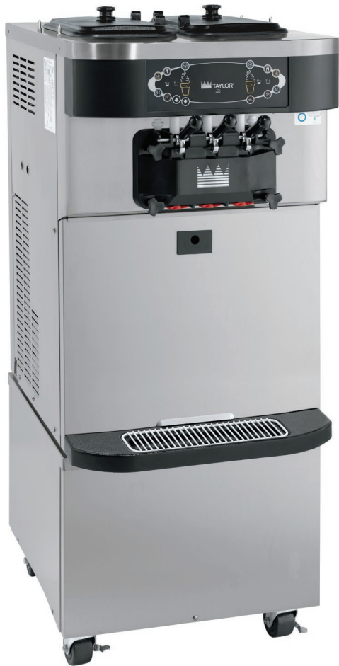
Se muestra con el carro ADA opcional