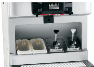
Opción de riel de jarabe integrado 2 a temperatura ambiente con tapas y cucharones, 2 calentados con bombas de jarabe