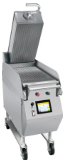
Modelo L828 incluye Plato superior estriado