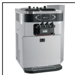
Ilustrada com direcionador de ar opcional.

Ilustração com carrinho de altura padrão (o carrinho é opcional)