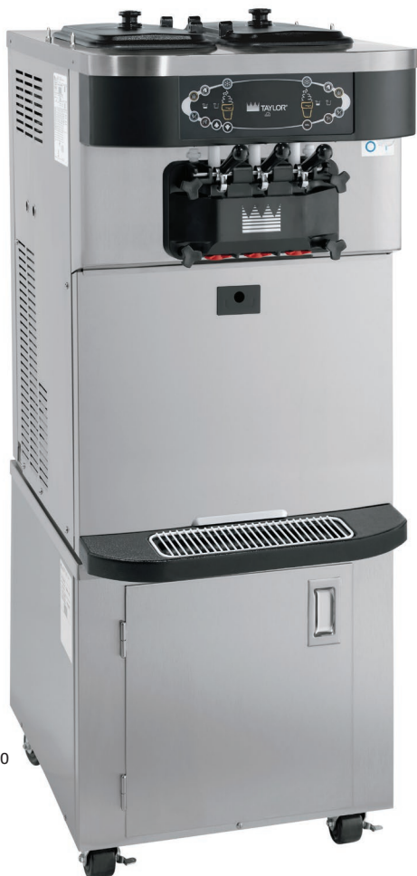
Ilustração com carrinho de altura padrão (o carrinho é opcional)