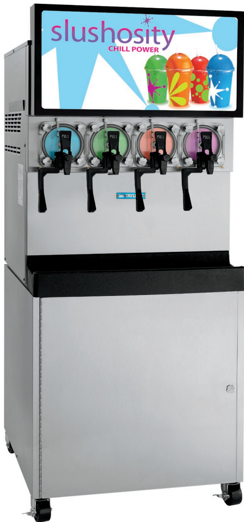
Se muestra con materiales de mercadeo Slushosity®. Consulte con su distribuidor de productos Taylor para conocer las opciones de mercadeo.